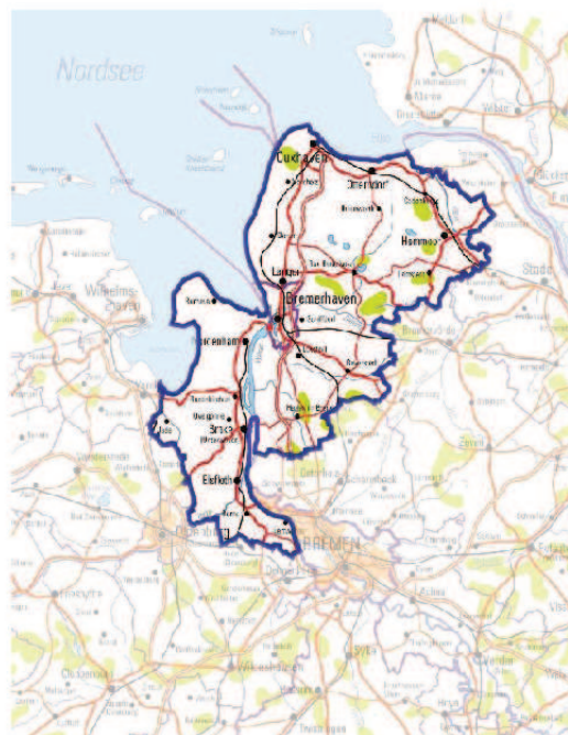
Gebiet des Regionalforum Unterweser

Dem Regionalforum können sämtliche Städte sowie Einheits- und Samtgemeinden aus dem Gebiet der Beteiligten beitreten. Aktuell sind folgende Kommunen Mitglieder des Regionalforums: die Landkreise Cuxhaven und Wesermarsch, die Städte Bremerhaven, Brake, Cuxhaven, Geestland und Nordenham sowie die Gemeinden Beverstedt, Hagen, Loxstedt, Schiffdorf und Wurster Nordseeküste. Die Zusammenarbeit ist freiwillig, dient aber als Basis für die Weiterentwicklung der interkommunalen und verbindlichen Kooperation.