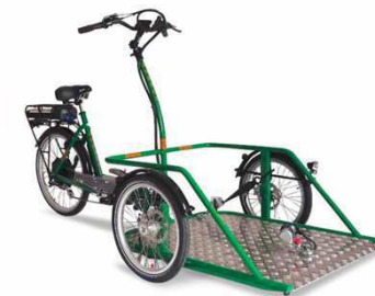
Rollstuhl Transportrad mit E-Motor