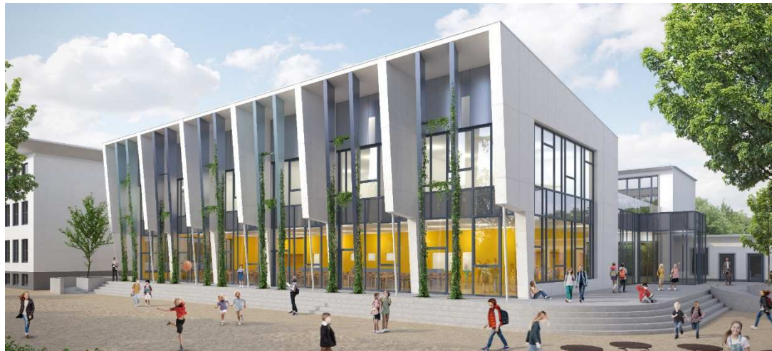
Bildrechte: Nico Dohm Architekten