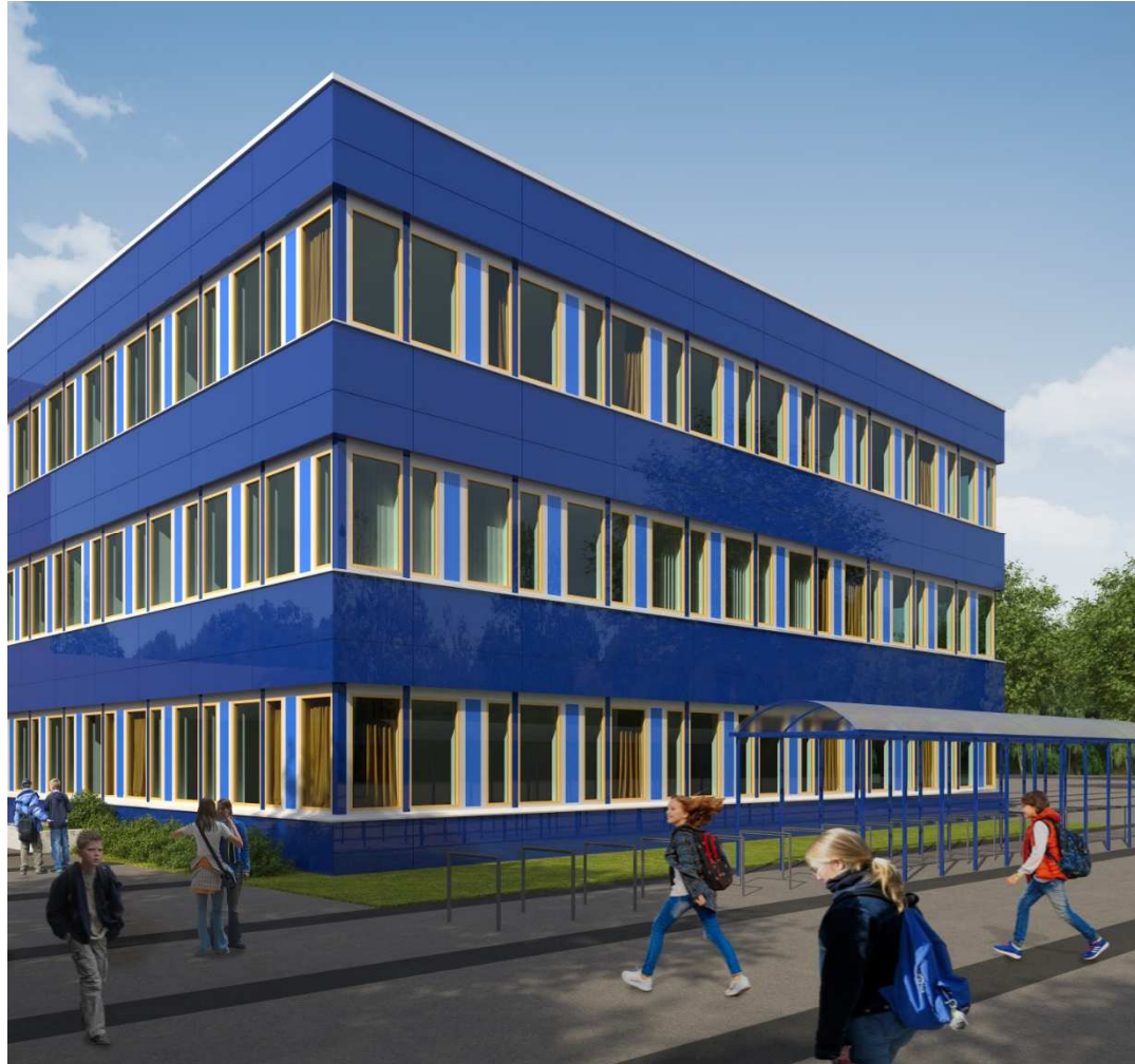
Bildrechte: Nico Dohm Architekten