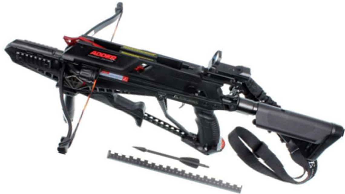
5-schüssige Armbrust: „Cobra System“ (Tatwaffe aus Bremerhaven)