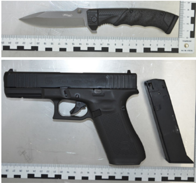
Abb.: Tatwaffen Einhandmesser und Schreckschuss-Pistole