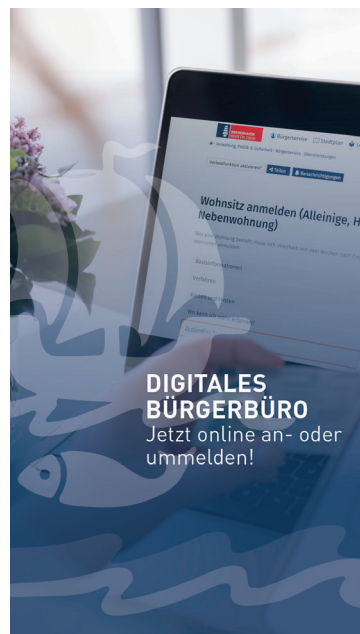
9:16 Format für Thumbnails