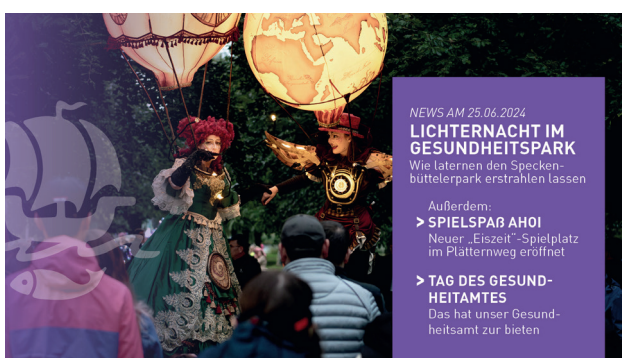
16:9 Format für WhatsApp