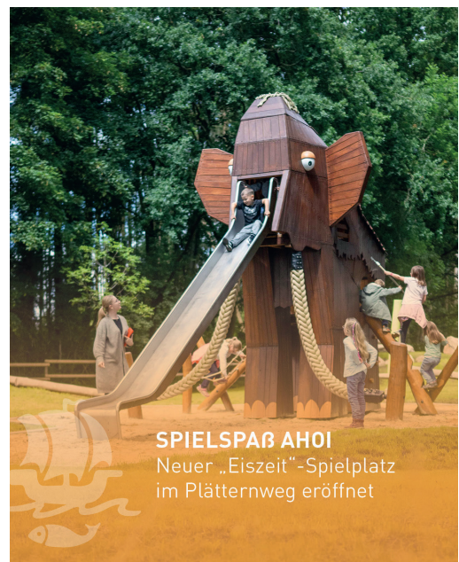
4:5 Format für Beiträge