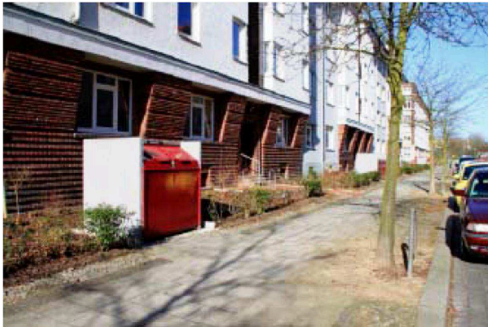
Vorgarten- gestaltung ohne Beachtung des historischen Vorbildes