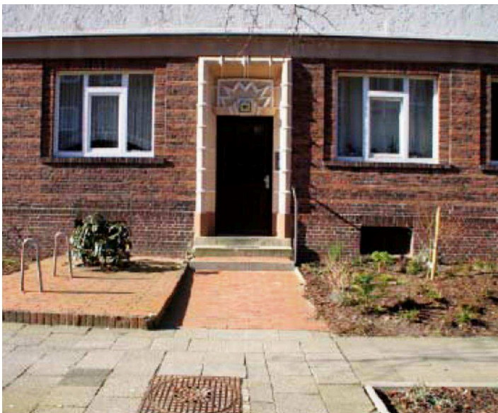
Rote Klinker als Oberflächen- material im Hauseingangs- bereich passen nicht in zu den ursprünglich einheitlich grau gehaltenen Gehwegen / Hauseingängen