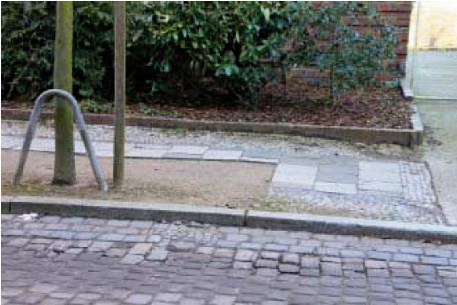
Baumstandorte ohne Einfassung